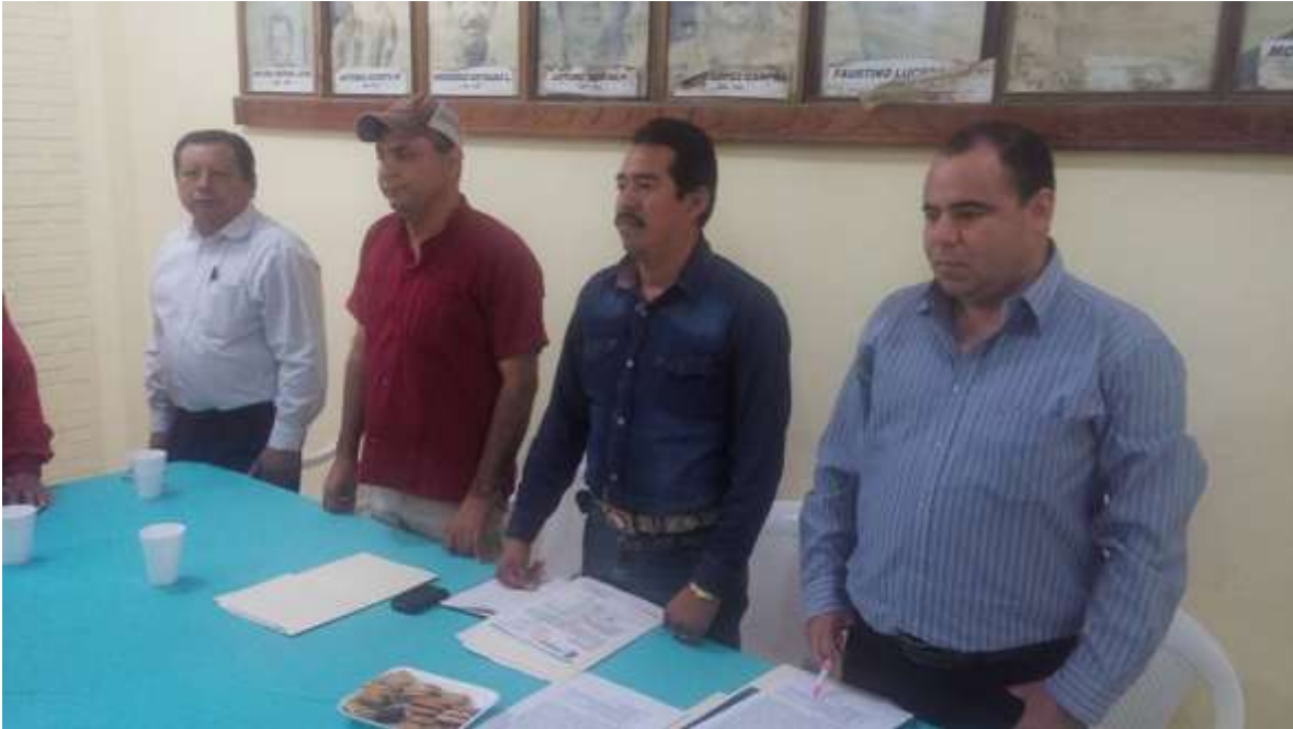
SESION DEL CONSEJO MUNICIPAL DE SEGURIDAD PÚBLICA