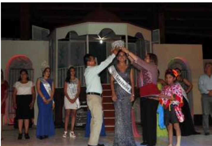
Coronación de la Reyna