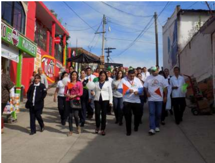
FERIA DE LA SALUD