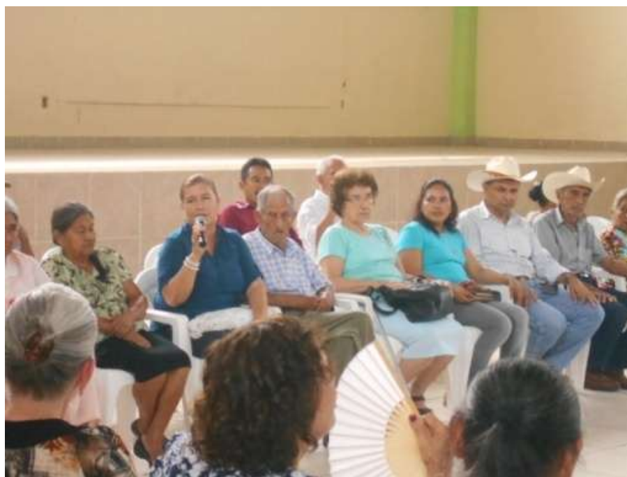
CONVIVIO DE INAPAM