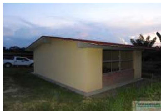
Construcción de 02 fachadas en ETV Lázaro Cárdenas, de la localidad de Tonatico y en el CBTA No. 160, de la localidad de Agua Fría, con una inversión de $447 mil 446 pesos 92 centavos.